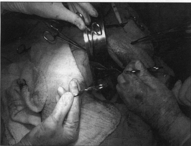
FIGURA 2a. Hernia perineal primaria: apertura del saco a nivel de su cuello.