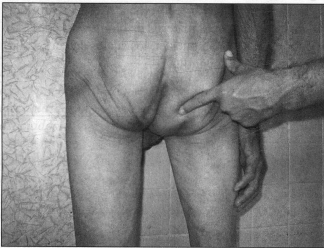
FIGURA 1. Hernia perineal primaria: posición ortostática.

dedor de su cuello, dejando el remanente distal in situ (figura 2a), se disecó todo el espacio y se colocó una bioprótesis de mersilene que se fija con puntos sueltos a todo el tejido circunvecino (figura 2b) y posteriormente se cerró el cuello del saco. Por último se disecó todo el espacio preperitoneal y repararon las hernias anteriores mediante la técnica de Stoppa. A los seis meses no se constata recurrencia alguna y se refiere mejoría del cuadro de estreñimiento.