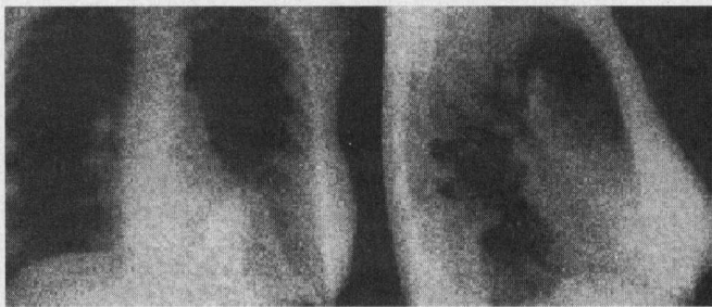
Figura 1. Rx de tórax PA y lateral izquierda en donde se observa la imagen correspondiente a la hernia de Bochdalek en la base del hemitórax izquierdo.