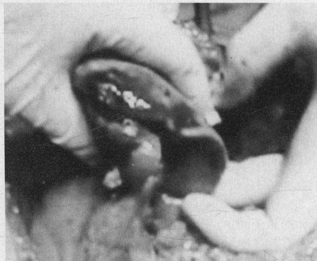
Figura 4. Bazo con lobulación adicional.