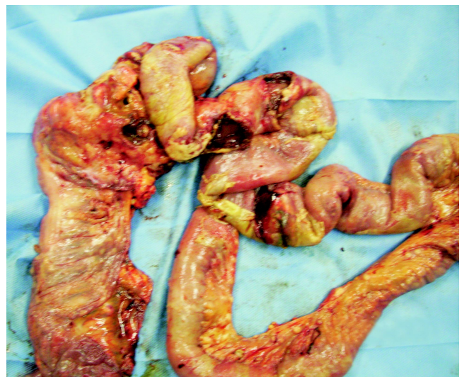
FIGURA 1. Múltiples perforaciones en íleon terminal y ciego secundarias a tuberculosis intestinal masiva.

La prevalencia mundial de infección por M. tuberculosis es de 32% y la incidencia de la enfermedad ha venido creciendo en la última década, lo cual se explica principalmente por la propagación de la infección por el VIH y el envejecimiento de la población (2) .