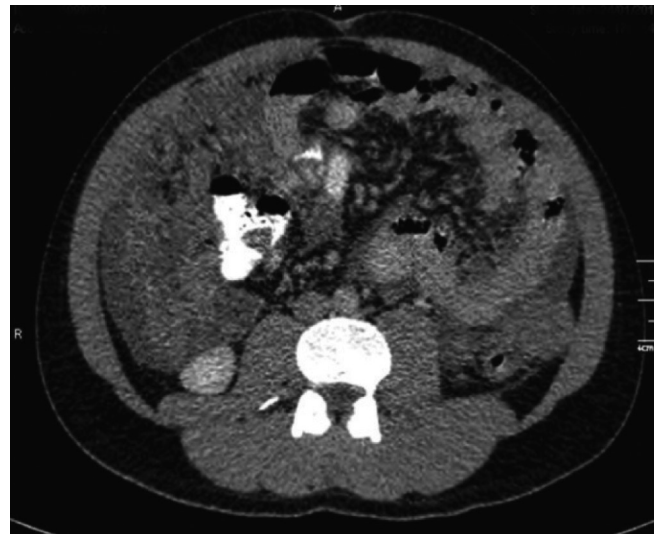
FIGURA 2. Tomografía axial computarizada de abdomen total con contraste: lesión neoplásica de origen mesentérico

En la Reunión Anual de la American Society of Clinical Oncology (ASCO) de 2007, se publicó un estudio que tuvo como objetivo determinar a corto plazo los resultados del paciente y la respuesta a la quimioterapia con doxorubicina, ifosfamida y vincristina en el tratamiento de los rabdomiosarcomas en adultos 25,39 (figura 3).