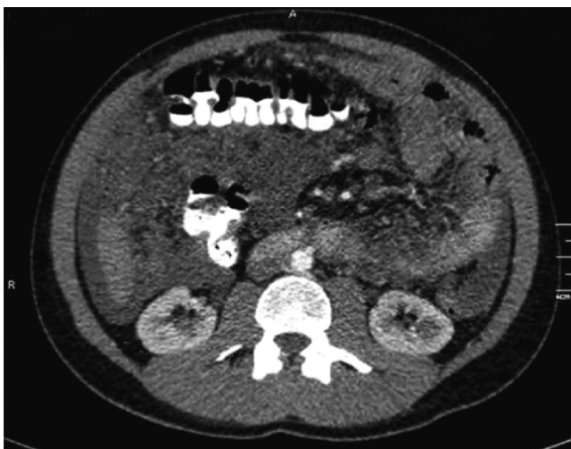
FIGURA 3. Tomografía axial computarizada de abdomen total con contraste: lesión neoplásica de origen mesentérico

Participaron 13 pacientes con rhabdomyosarcoma adultos (8 hombres y 5 mujeres) que se encontraron a partir de 1998 y hasta el 2006 39,40-42 . De estos pacientes, seis tenían enfermedad metastásica, cuatro tenían tratamiento neoadyuvante y tres, tratamiento adyuvante 39,43,44 . Uno de los pacientes con enfermedad metastásica se negó al tratamiento. Doce pacientes se trataron con doxorubicina, ifosfamida y vincristina, e, inicialmente, dos pacientes también recibieron ciclofosfamida 39,44,45 .