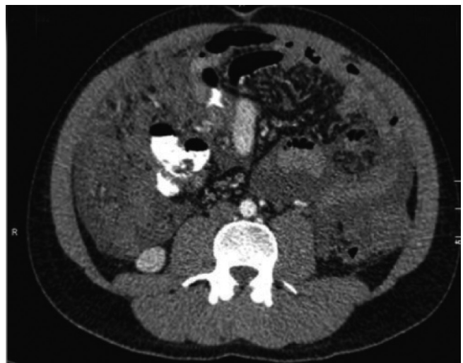
FIGURA 1. Tomografía axial computarizada de abdomen total con contraste: evidencia de masa de probable origen mesentérico

La edad de los pacientes osciló entre 17 y 84 años (mediana, 27 años). Entre los subtipos histológicos, se encontraron embrionarios (34 %), pleomórficos (43 %) y alveolares (23 %) 2 . Los sitios anatómicos de origen fueron cabeza y cuello (52 %), retroperitoneo (26 %) y las extremidades (7 %) 18 . El tamaño del tumor fue de 5 cm o menos en 51 % de los pacientes. Las metástasis en ganglios linfáticos regionales se presentó en 33 % de los casos 6,19 . El tratamiento consistió únicamente en radioterapia en el 11 %, en radiación y cirugía en el 18 %, en radiación y quimioterapia en el 34 %, y en las tres modalidades en el 37 %. Se realizó una mediana de seguimiento de 10,5 años, con supervivencia libre de enfermedad y supervivencia global de 41 % y 40 %, respectivamente. El factor determinante principal del control de metástasis y la supervivencia, fue el tamaño del tumor primario (de 5 cm o menor Vs. mayor de 5 cm). El control local fue satisfactorio: 10 años, tasa de 87 % 18 (figura 1).