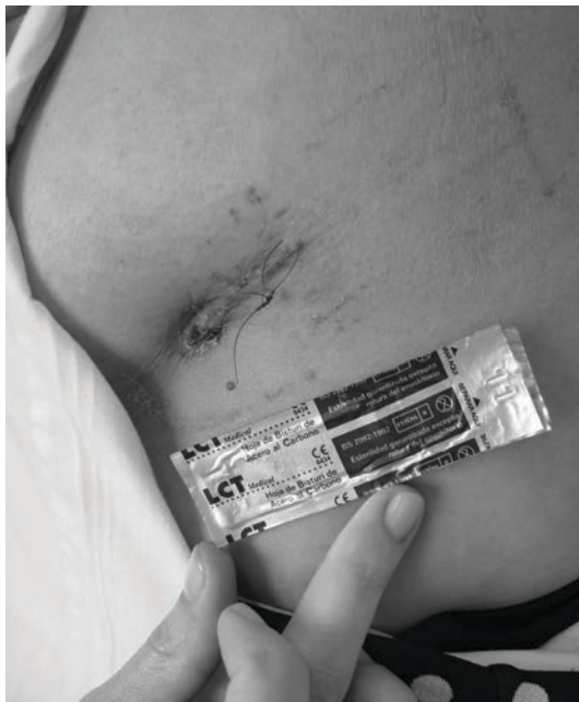
Figura 1. Abordaje quirúrgico para la lobectomía toracoscópica por un solo puerto, incisión de 40 mm

Se estudiaron variables demográficas y otras de interés, como el tiempo operatorio, la estancia hospitalaria, la duración del tubo de tórax, las complicaciones relacionadas con el procedimiento o con la enfermedad de base y la cantidad de ganglios extraídos en los casos de cáncer de pulmón.