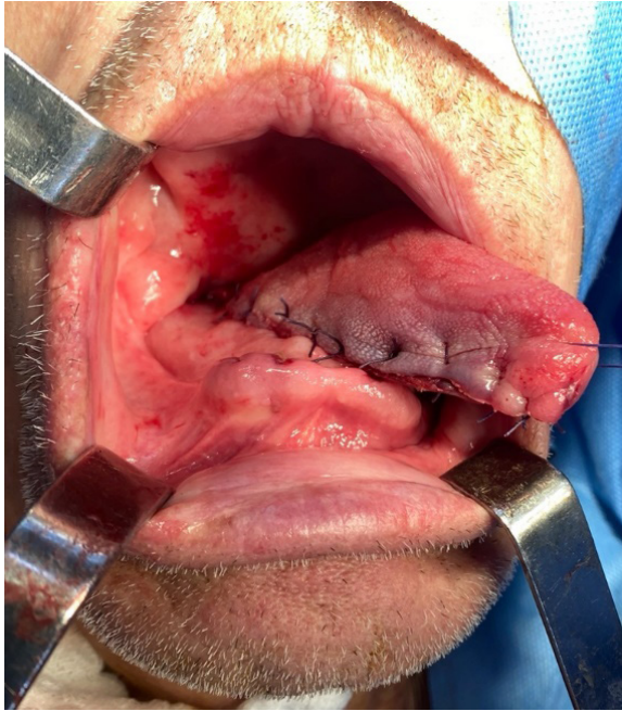
Figura 2. Aspecto postoperatorio de la hemiglosectomía sin reconstrucción, afrontamiento de bordes a sutura primaria con poliglactina 3-0; fueron extraídos restos radiculares de la región anterior de la mandíbula.

Se hizo manejo conjunto con fonoaudiología por los trastornos funcionales de la deglución y fonación, y fue remitido a Oncología, quienes indicaron seis ciclos de quimioterapia con cisplatino. Cuatro meses luego de la cirugía, el paciente presentó recidiva local, con gran tumoración endofítica, induración de los bordes de la lengua, pérdida de su movilidad e invasión al piso de la boca (Figura 4). Se le propuso una cirugía de rescate, que no fue aceptada, optando por el tratamiento paliativo, pero falleció por recidiva tumoral a los pocos meses.