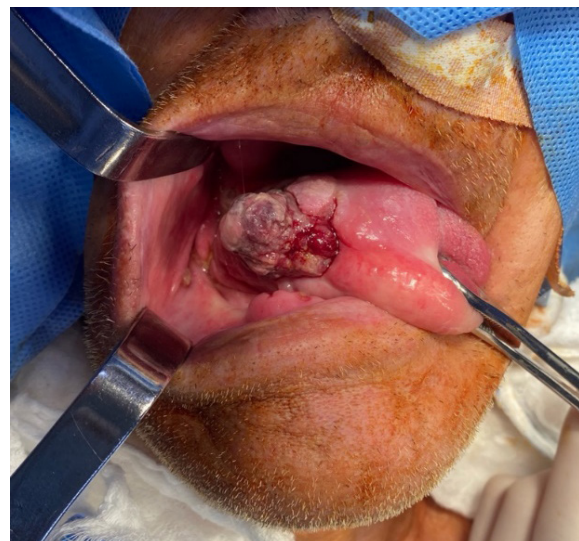
Figura 1. Aspecto preoperatorio de la lesión.

La resonancia nuclear magnética (RNM) informó una masa hipocaptante, expansiva, infiltrante, de contornos lobulados y morfología oval, de aproximadamente 54 x 28 mm, que comprometía el plano muscular de la lengua, sobrepasando la línea media y con realce de contraste heterogéneo. Se clasificó como estadio T4a N2b M0 y se llevó a hemiglosectomía sin reconstrucción, con vaciamiento supra-omohiideo ipsilateral (Figuras 2 y 3). La evolución postoperatoria fue adecuada y se dio de alta al cuarto día postoperatorio. El informe final de anatomía patológica fue: "Carcinoma escamoso sarcomatoide de alto grado histológico. Márgenes laterales y profundos libres de tumor" .