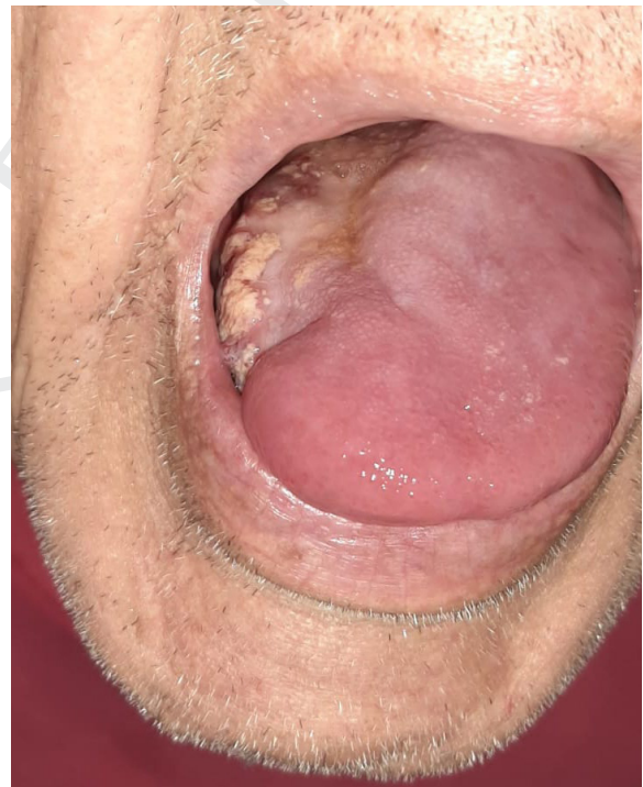
Figura 4. Recidiva de la lesión al cuarto mes postquirúrgico con fijación de la lengua al piso de la boca que dificulta la deglución y la fonación.

recurrencia local 2 , situación sufrida por el paciente presentado.