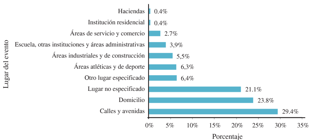
FIGURA 2. Porcentaje de casos por lugar de evento registrados en el periodo de siete meses (enero-julio) en las dos instituciones