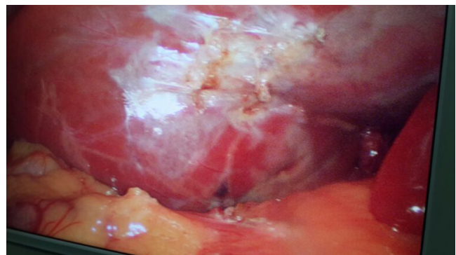
FIGURA 1. Ausencia de la vesícula biliar

Se programó para colecistectomía ambulatoria, mediante abordaje por cuatro puertos. Se encontraron algunas adherencias al borde hepático, las cuales se liberaron,