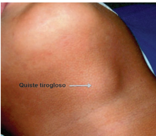
FIGURA 1. Quiste del conducto tirogloso

No cabe duda de que el tratamiento estándar para el quiste del conducto tirogloso es la resección quirúrgica y clásicamente se ha recomendado la remoción del quiste mediante el procedimiento de Sistrunk 10-12 , en el que se extrae el cuerpo del hueso hioides y un segmento muscular adyacente 13 . Según lo reportado en la literatura científica, el obviar la resección de la porción central del hueso hioides genera una recurrencia hasta de 10 % 12 .