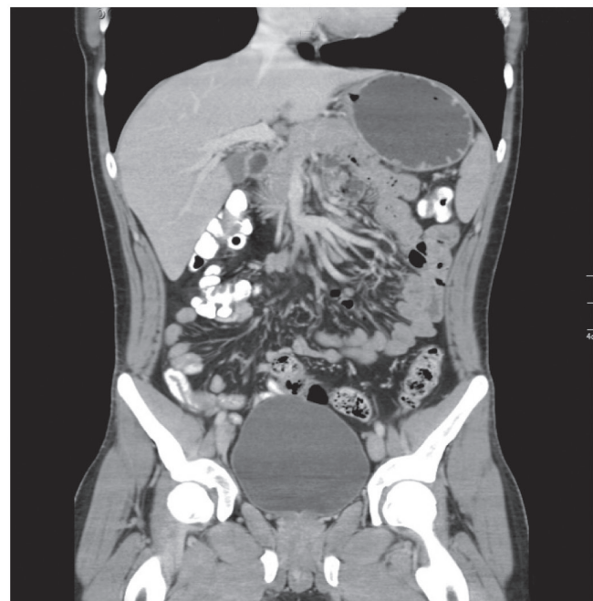
FIGURA 2. Escanografía abdominopélvica