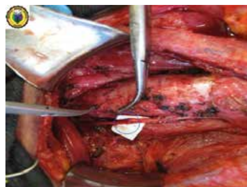
Figura 3. Tiroidectomía total con vaciamiento ganglionar central; se visualiza la reconstrucción del nervio laríngeo recurrente izquierdo con la técnica de Horsley (círculo azul).