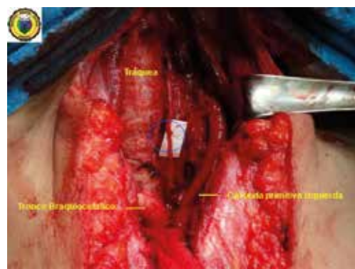
Figura 2. Se visualiza la reconstrucción del nervio laríngeo recurrente izquierdo con la técnica de Horsley (círculo azul).