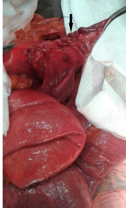
Figura 3. Transoperatorio. Cierre del orificio herniario con sutura continua no absorbible (flecha negra).