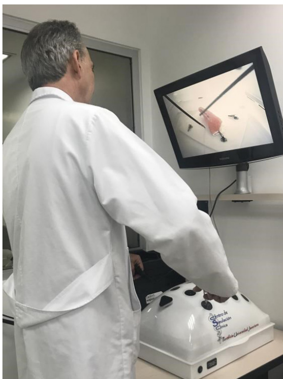
Figura 2. Práctica en el simulador de laparoscopia (pelvitainer)

Este estudio es de tipo descriptivo y cualitativo; por lo tanto, no se hace ninguna intervención sobre los participantes. Se clasifica como un estudio “sin riesgo”, según la Resolución 008430 de