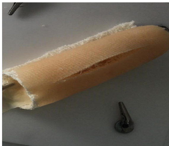
Figura 1. Tejido con herida lineal, moldeado cilíndricamente y ajustado al simulador de laparoscopia ( pelvitrainer )

La práctica se hizo en un simulador de laparoscopia, con cámaras de 1.080 pixeles, utilizando como instrumentos laparoscópicos un porta-agujas y una pinza Maryland (figura 2). Antes de iniciar la práctica, se dio a conocer el propósito del estudio a todos los participantes, las características por evaluar y el proceso de evaluación del tejido. Se dieron instrucciones sobre el uso del tejido, las suturas y el anudado. Al finalizar la práctica, se envió por correo electrónico un cuestionario semiestructurado a cada uno de los participantes para que, de forma anónima, evaluaran cuatro aspectos principales: estética, sensación general, utilidad y la actitud en general hacia el tejido (apéndice 1).